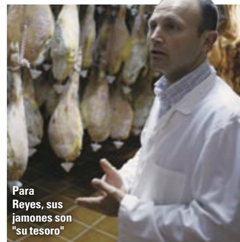
Para Reyes, sus jamones son "su tesoro"