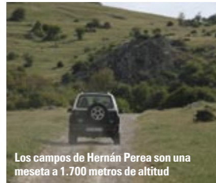
Los campos de Hernán Perea son una meseta a 1.700 metros de altitud