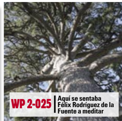
WP 2-025 Aquí se sentaba Félix Rodríguez de la Fuente a meditar