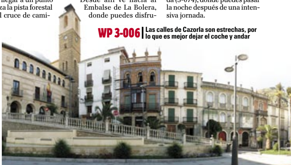
Cazorla tiene rincones imprescindibles, como la Iglesia Mayor de Santa María

WP 3-006 | Las calles de Cazorla son estrechas, por lo que es mejor dejar el coche y andar