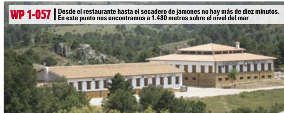
WP 1-057 Desde el restaurante hasta el secadero de jamones no hay más de diez minutos. En este punto nos encontramos a 1.480 metros sobre el nivel del mar