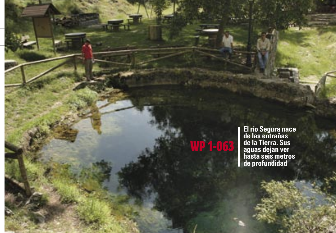
WP 1-063 El río Segura nace de las entrañas de la Tierra. Sus aguas dejan ver hasta seis metros de profundidad