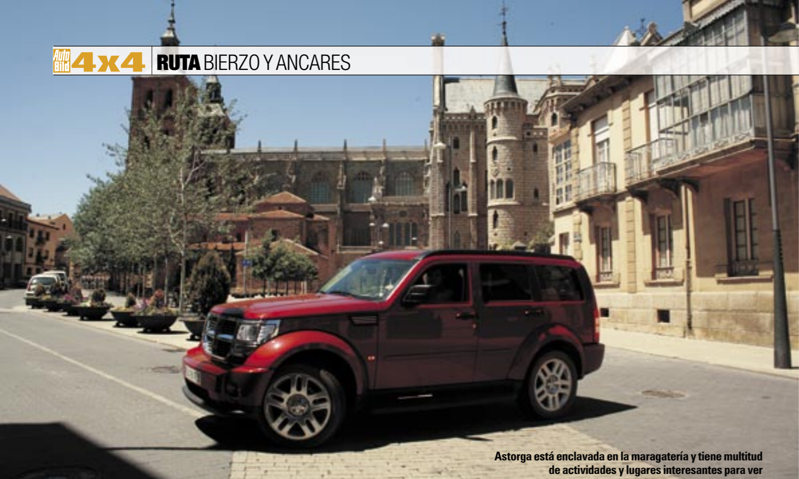
Astorga está enclavada en la maragatería y tiene multitud de actividades y lugares interesantes para ver