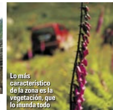
Lo más característico de la zona es la vegetación, que lo inunda todo