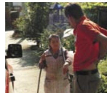
Las gentes conservan sus costumbres ancestrales (izda.); un ejemplo de la arquitectura tradicional (dcha.); abajo, cultivo de judías

y por su lejanía, pues muchas veces las carreteras terminan en su destino. La capital de los Ancares es Candín, y sus pueblos más representativos son Burbia y Campo del Agua. Se llega por caminos intrincados, hechos para conductores algo experimentados en 4x4.