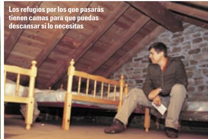
Los refugios por los que pasarás tienen camas para que puedas descansar si lo necesitas