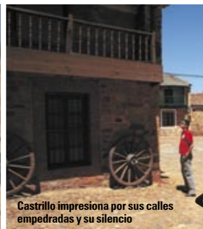
Castrillo impresiona por sus calles empedradas y su silencio