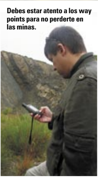
Debes estar atento a los way points para no perderte en las minas.