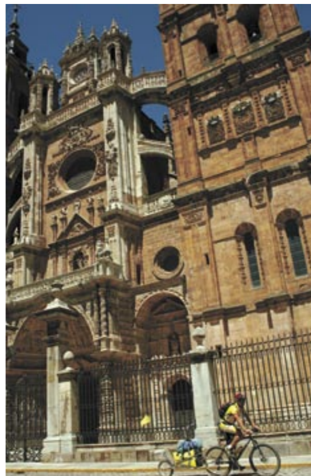
WP 2-001 Es habitual ver caminantes y ciclistas en Astorga, porque por allí pasa el Camino