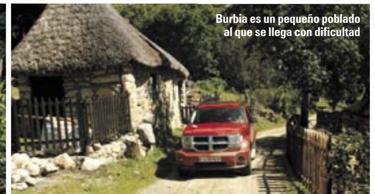
Burbia es un pequeño poblado al que se llega con dificultad