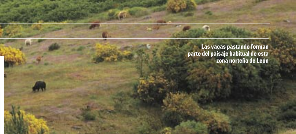
Las vacas pastando forman parte del paisaje habitual de esta zona norteña de León

No olvides el bocata, porque vas a disfrutar de un verdadero día de campo. Pasarás por tres cabañas acondicionadas con cocina y camas, por si te entran ganas de dormir, y recorrerás caminos flanqueados por espectaculares paisajes. Después, mejor que conduzcas hasta Astorga, desde donde partirás en la segunda etapa.