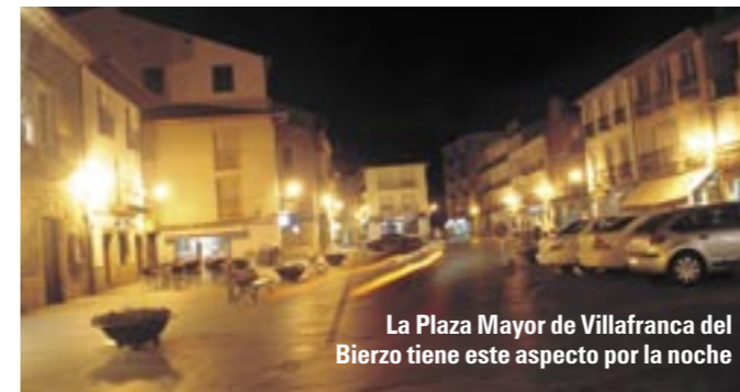
La Plaza Mayor de Villafranca del Bierzo tiene este aspecto por la noche