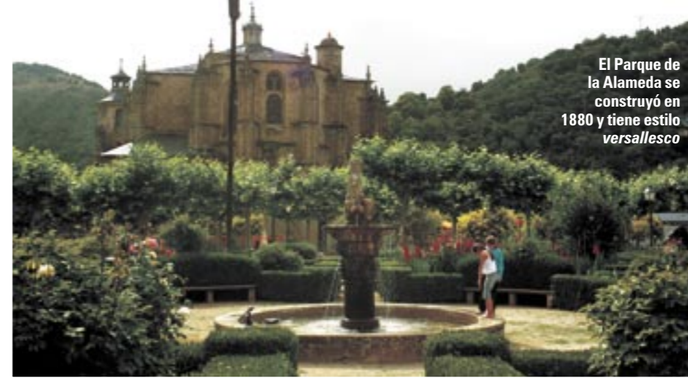
El Parque de la Alameda se construyó en 1880 y tiene estilo versallesco