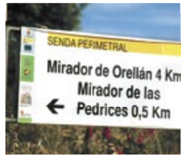
Estos son dos de los mejores miradores de Las Médulas