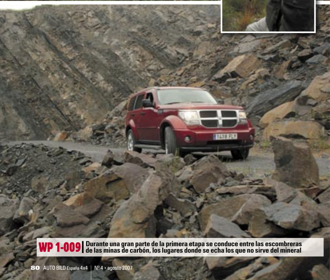
WP 1-009 Durante una gran parte de la primera etapa se conduce entre las escombreras de las minas de carbón, los lugares donde se echa los que no sirve del mineral