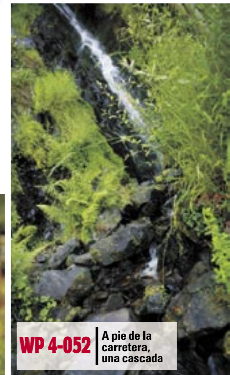
WP 4-052 | A pie de la carretera, una cascada