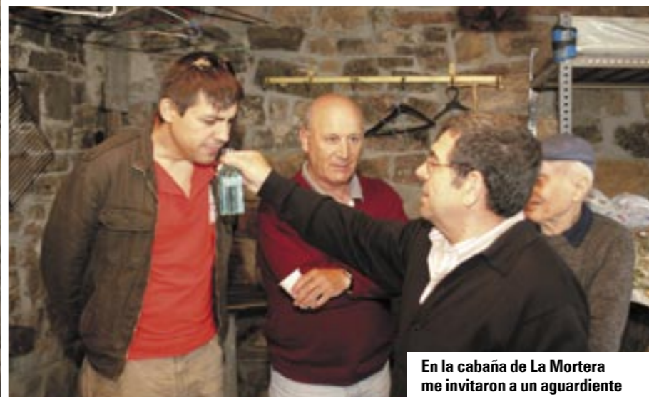
En la cabaña de La Mortera me invitaron a un aguardiente