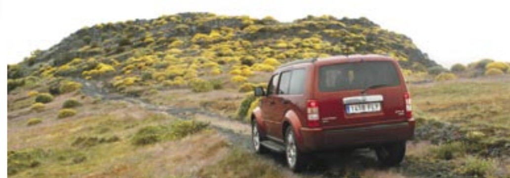
WP 1-013 Aunque tiene aspecto de rudo todoterreno, hay que tener cuidado al meter el Dodge Nitro en el campo: es demasiado ancho y no tiene neumáticos preparados