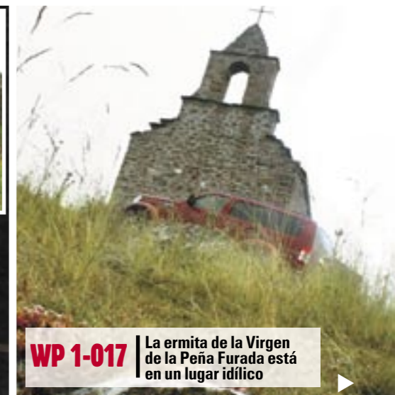
WP 1-017 La ermita de la Virgen de la Peña Furada está en un lugar idílico