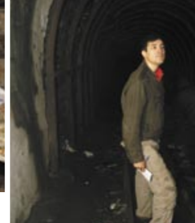
Impresiona entrar en una mina y ver las condiciones en las que se trabajaba allí hasta los años 80