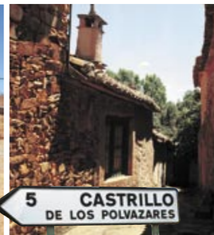
5 CASTRILLO DE LOS POLVAZARES