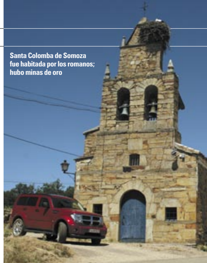
Santa Colomba de Somoza fue habitada por los romanos; hubo minas de oro