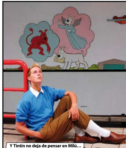
Y Tintín no deja de pensar en Milú...