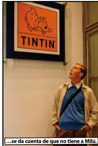
...se da cuenta de que no tiene a Milú.