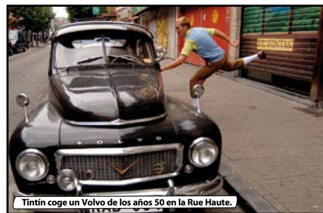
Tintín coge un Volvo de los años 50 en la Rue Haute.