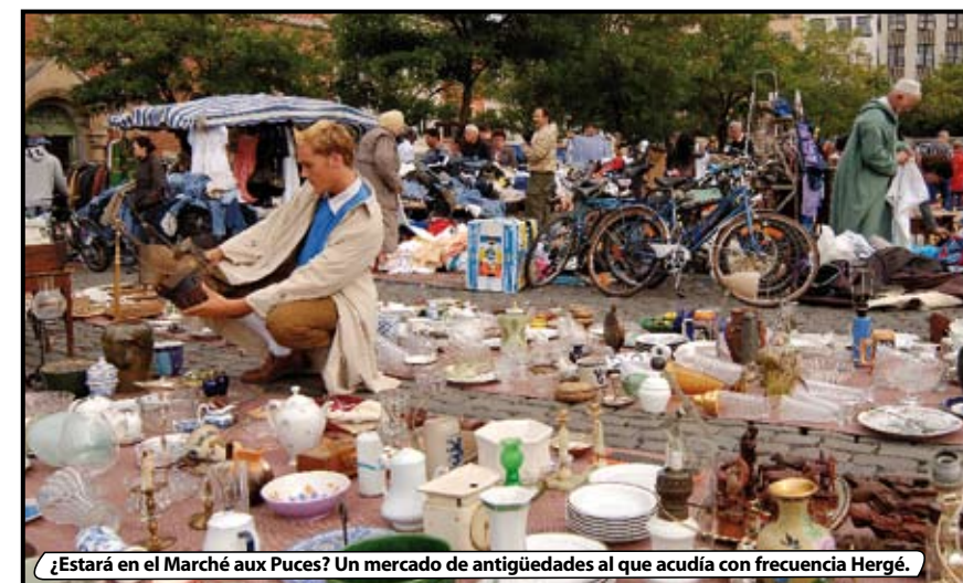
¿Estará en el Marché aux Puces? Un mercado de antigüedades al que acudía con frecuencia Hergé.

de Ottokar . Por eso, he ido a ambos sitios a buscar a mi perro, el mismo que me acompañó a lo largo de 22 historias, sin contar con la primera ( Tintín en el país de los soviets ) ni con la última e inconclusa, Tintín y el Arte-Alfa . Pero aun así, no he logrado encontrarlo en ninguno de estos lugares. Pero el único sitio donde le veía era sobre los murales de la ciudad en forma de pintura, en las tiendas como un peluche, en el gran