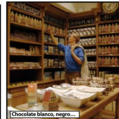
Chocolate blanco, negro...