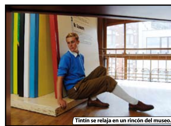
Tintín se relaja en un rincón del museo.