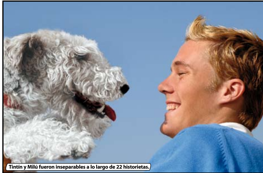
Tintín y Milú fueron inseparables a lo largo de 22 historietas.

fue él quien le puso el nombre con el que cariñosamente llamaba a su primera novia. Sí, mi padre era un sentimental. Durante la Segunda Guerra Mundial huyó a Francia, pero regresó poco después y comenzó a trabajar en un periódico controlado por los alemanes. Por ello, al final de la guerra fue acusado de colaboracionista, aunque poco importó, porque tanto él como yo nos íbamos convirtiendo en mito.