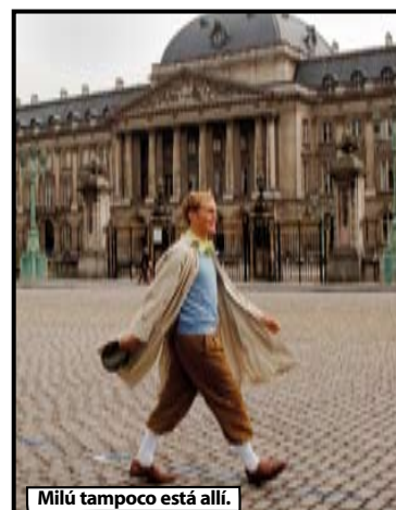
Milú tampoco está allí.