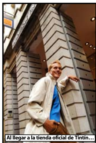
Al llegar a la tienda oficial de Tintín...