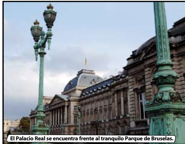
El Palacio Real se encuentra frente al tranquilo Parque de Bruselas.