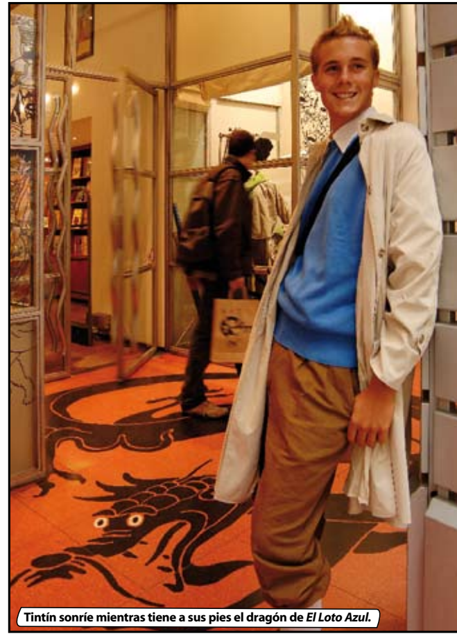
Tintín sonríe mientras tiene a sus pies el dragón de El Loto Azul .