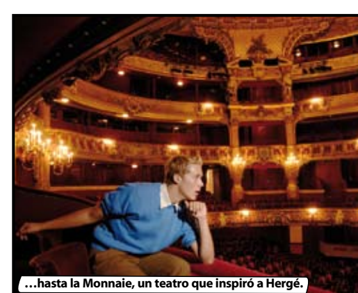
...hasta la Monnaie, un teatro que inspiró a Hergé.

Debe ser por mi ropa o por mi cara de niño, pero cuando paseo por las calles de Bruselas, todos me observan, me señalan con el dedo y sonríen. Parece que me reconocen. Algunos me han dicho que soy el héroe de su infancia y que ojalá se parecieran a mí, aunque sólo soy un chico como otro cualquiera, muy similar a Georges Remi, mi padre, al que todos llamaban Hergé. Por eso soy periodista, porque él trabajó en el diario Le Soir tras la Segunda Guerra Mundial; aventurero, a él le hubiera encantado viajar y meterse en los líos que me meto yo, y joven, pues tan sólo tengo 20 años, la edad con la que me creó mi padre. Y lo mejor es que desde 1929, año en que nací en blanco y negro y mi padre me envió al país de los soviets, no he cambiado casi nada. Bueno, sólo una cosa: que todos han leído mis aventuras a todo color. Por cierto, mi nombre es Tintín.