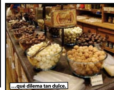
...qué dilema tan dulce.