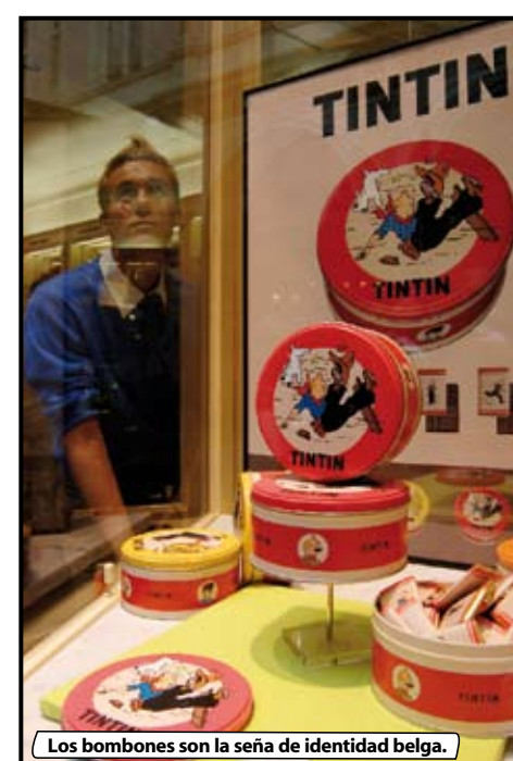
Los bombones son la seña de identidad belga.