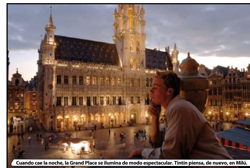
Cuando cae la noche, la Grand Place se ilumina de modo espectacular. Tintín piensa, de nuevo, en Milú.

dibujo que se ha inaugurado este año con motivo del nacimiento de mi padre en la Gare du Midi, en el que se me ve en una escena de Tintín en América , y en la composición con todos los personajes de mis aventuras que, poco antes de su muerte, proyectó mi padre para la estación de metro de Stokkel, al final de la línea 1B, que se llevó a cabo en 1988 y que ha sido restaurada este mismo año.