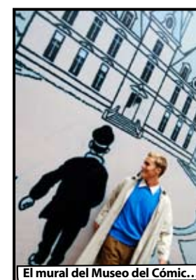
El mural del Museo del Cómic...