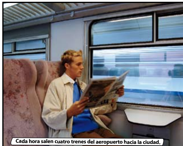
Cada hora salen cuatro trenes del aeropuerto hacia la ciudad.