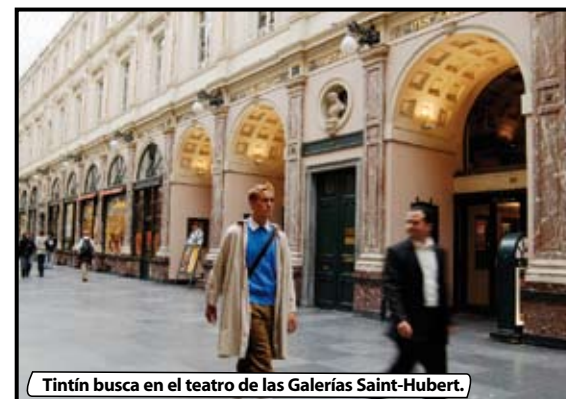
Tintín busca en el teatro de las Galerías Saint-Hubert.

DE LAS DECENAS DE PERSONAJES CREADOS POR AUTORES DE BÉLGICA A LO LARGO DEL ÚLTIMO SIGLO, SALVO TINTÍN, NINGUNO HA TENIDO NI TIENE MAYOR PRESENCIA EN LA VIDA COTIDIANA DE LOS BELGAS.