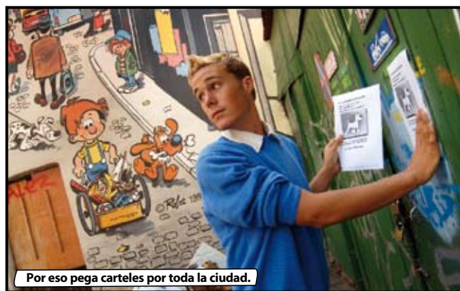
Por eso pega carteles por toda la ciudad.