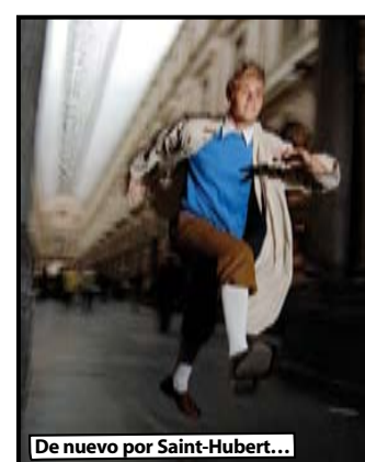
De nuevo por Saint-Hubert...