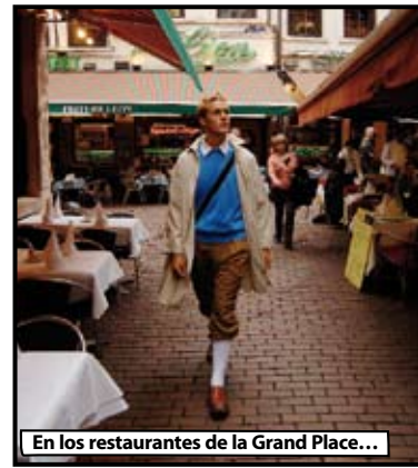
En los restaurantes de la Grand Place...