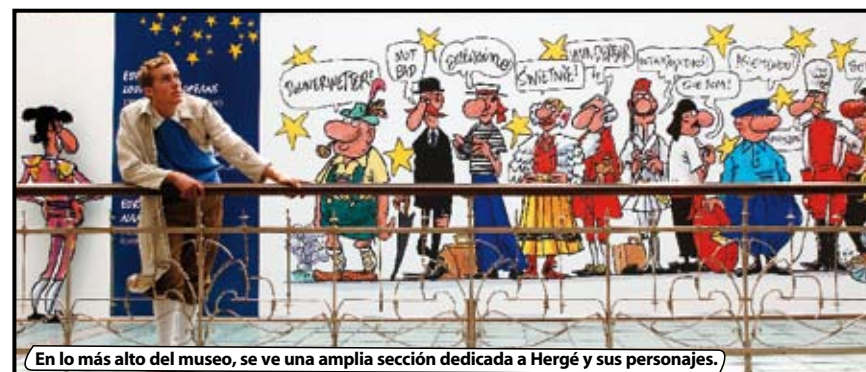
En lo más alto del museo, se ve una amplia sección dedicada a Hergé y sus personajes.