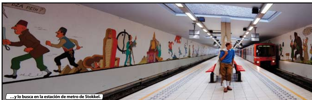
...y lo busca en la estación de metro de Stokkel.

un apartado especial para mis aventuras. Lo he buscado en otro teatro, el de La Monnaie. La razón es sencilla: mi padre siempre dibujó ficción a partir de la realidad, actualidad e historia. No sólo muchos de sus personajes fueron creados a partir de personas reales –Silvestre Tomasol es muy parecido a un profesor llamado Auguste Piccard, y el rey Muksar de Syldavia es sospechosamente similar a Alfonso XIII–, sino que