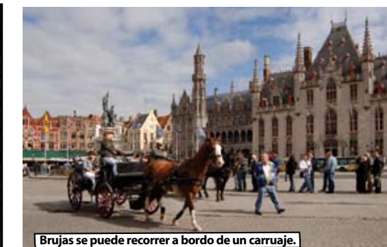
Brujas se puede recorrer a bordo de un carruaje.