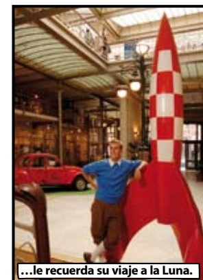
...le recuerda su viaje a la Luna.