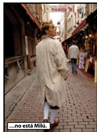
...no está Milú.

DE LAS DECENAS DE PERSONAJES CREADOS POR AUTORES DE BÉLGICA A LO LARGO DEL ÚLTIMO SIGLO, SALVO TINTÍN, NINGUNO HA TENIDO NI TIENE MAYOR PRESENCIA EN LA VIDA COTIDIANA DE LOS BELGAS.